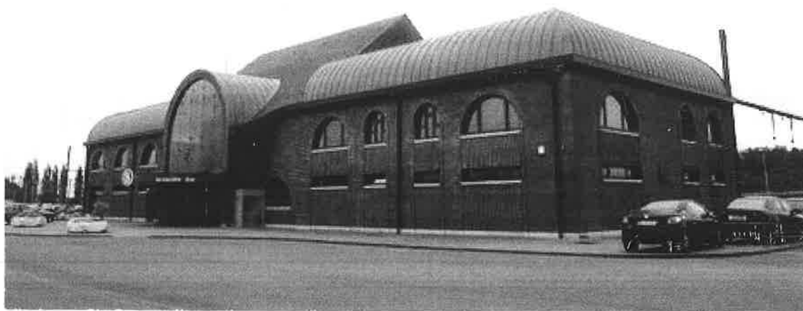
Vue actuelle de la nouvelle gare de La Louvière Sud

Le coût de cette construction se monte à 2.100.000 d'Euros.