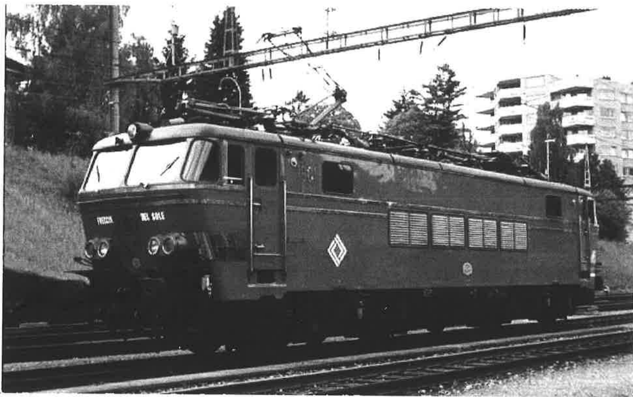
La 1601 ayant assuré un Freccia del Sole à l'enseigne de Railtour arbore fièrement son quatrième pantographe ... Thun (CH), à l'été 1974.

La séance, animée et féconde en échanges d'idées fut levée à 21h40.