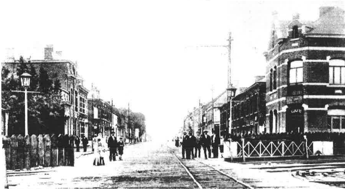
Passage à niveau de la Chaussée Paul Houtart à Houdeng

métallique permettant la libre circulation des convois ferroviaires mais aussi des péniches. Cet ouvrage a été démolit et la darse remblayée.