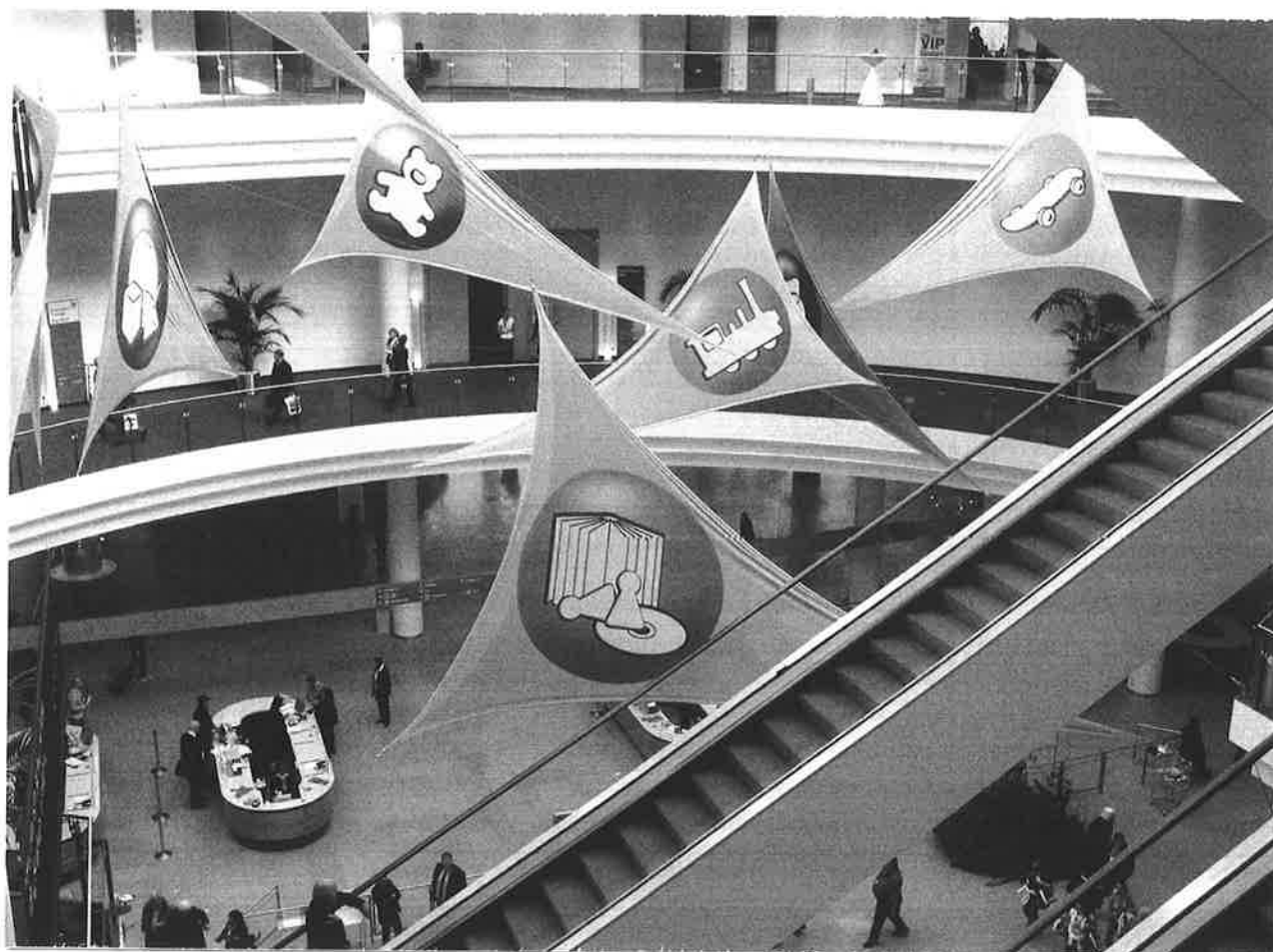
Vue d'ensemble du pavillon d'accueil central est

Le secteur du train est loin d'avoir retrouvé une parfaite stabilité. Les problèmes du groupe Lehman (LGB) évoqués l'an dernier ont conduit au rachat de